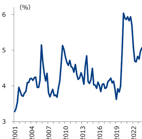
注：直近は23年7-9月期。出所：米国商務省より三菱総合研究所作成