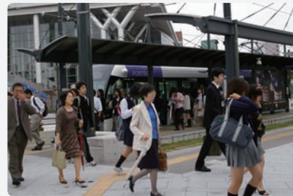
日本で初めて導入された本格的なLRT。人と環境にやさしい公共交通として注目を集めている(上、下右) LRTのネットワーク図。将来的に他路線との接続も計画されており、さらなる利便性の向上と地域活性化が期待されている(下左)