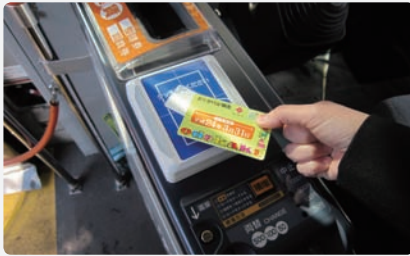
高齢者の3割が持っている「おでかけ定期券」。往復200円で市内の隅々にまで行くことができ、高齢者の外出機会が増えている

かすこともでき、誇りをもって暮らしていくことです。それを一言でいうと、やはり「雇用」ということになるでしょう。これからの人口減少社会では、社会参加の動きをどのようにつくっていくかが重要になりそうです。