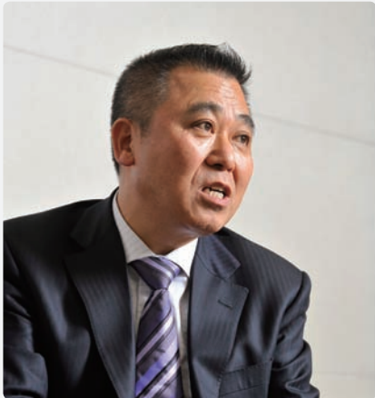
森 雅志 (もり・まさし)

富山市長。1952年生まれ。富山中部高校・中央大学法学部卒。95年富山県議会議員に初当選。99年再選を果たす。2002年旧・富山市長に初当選。05年市町村合併で発足した現・富山市長に当選。趣味は登山や語学、サクソ演奏など多岐にわたる。また自身のホームページ「森のひとりごと」( http://www.morimasashi.jp/ )にエッセイを寄せる。