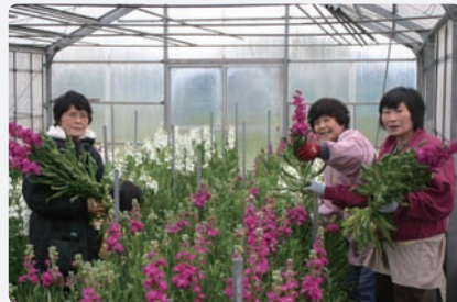
「技術の伝承」を目的に市が設立した農業学校では、高齢者を中心とする市民が生き生きと身体を動かしている。梨の一次摘果：5月(上)、ナスの支柱誘引：6月(下左)、ストックの採花：11月(下右)

らといって、働けないわけではありませんからね。富山市では農家の高齢化が進んでいますが、そのなかには農業の名人たちがいます。非常に高度な農業技術をもっており、おいしい野菜をつくることができるのですが、たとえば大根づくりの名人は、筋力的な問題で、大根を畑から抜き、農道まで運んで出荷する作業ができず、農業が続けられなくなってしまいます。この結果、何より問題なのは「技術の伝承」ができないことです。そこで、市では農業の学校を開校しました。