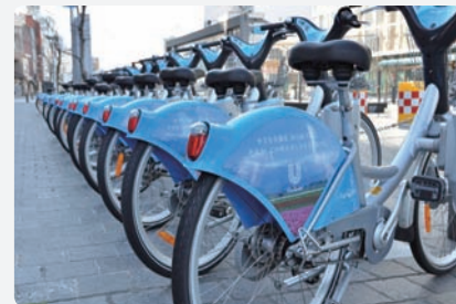
市の中心部にある、街なか賑わい広場「グランドプラザ」。一年を通してさまざまなイベントが行われ、市民がふれあう憩いの場となっている(上) 自転車の共同利用システム「アヴィレ」も導入。市内各所にあるステーションから自由に自転車を利用し、任意のステーションに返却できる(下左) 特殊プラスチックパネルの上をスケート靴で滑る、冬の人気イベント「エコリンク」(下右)