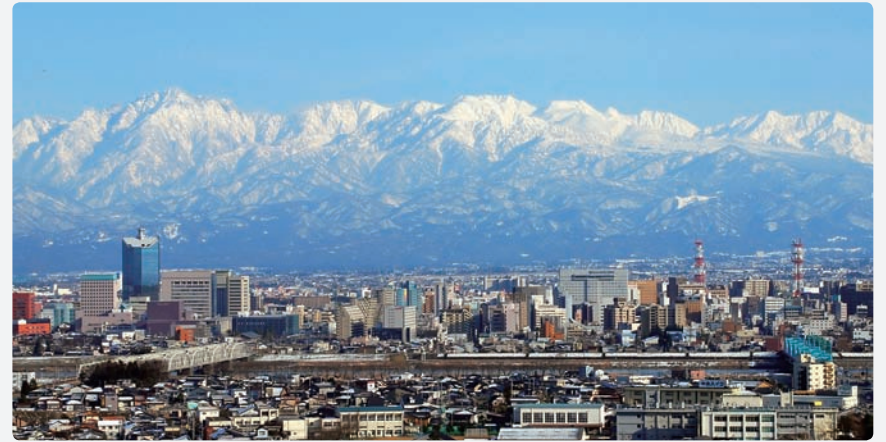
富山市の東に位置する雄大な立山連峰は、四季折々の多彩な表情を見せる

「住みよいまち」づくりにおいて、最も重要なのは「雇用」と考えており、これこそが安定的に人口を吸引する源となります。ただし、これまでのような企業誘致をしようとするわけではありません。