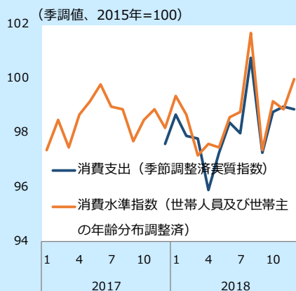
図表 実質消費支出の水準

注：二人以上世帯。18年1月以降は調査方法の変更の影響による変動を調整した変動調整値。