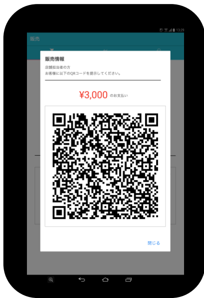
【店舗タブレット】 商品情報のQRコード表示