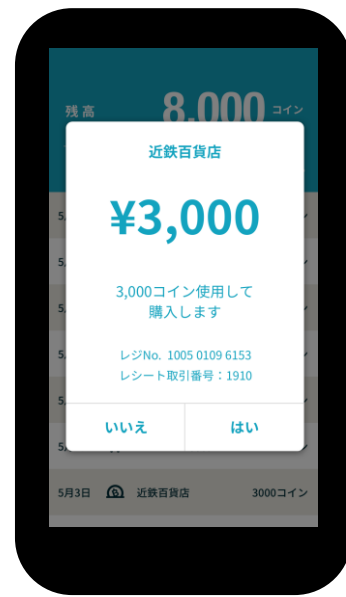
【お客様のスマートフォン】 QRコードを読み取った後の画面