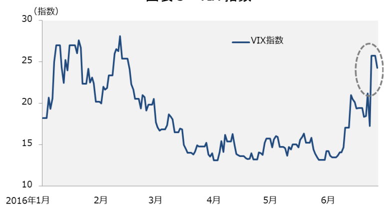
図表3 VIX 指数