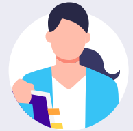
新規事業を 推進している方

月額45万円～で、抱える課題に応じた「事業開発の推進」と「事業開発ノウハウの習得・定着」を同時に実現！