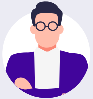
新規事業部署の 管理職の方